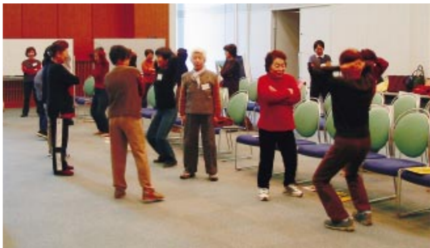
介護予防教室「骨太美人」

国民健康保険税・第4期 (納期限 9/30) 介護保険料普通徴収分・第3期 (納期限 9/30)