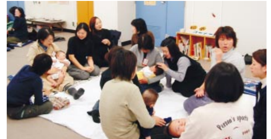
パパママ教室育児編

町府民税・第4期分 (納期限 1/31) 国民健康保険税・第8期 (納期限 1/31) 介護保険料普通徴収分・第7期 (納期限 1/31)